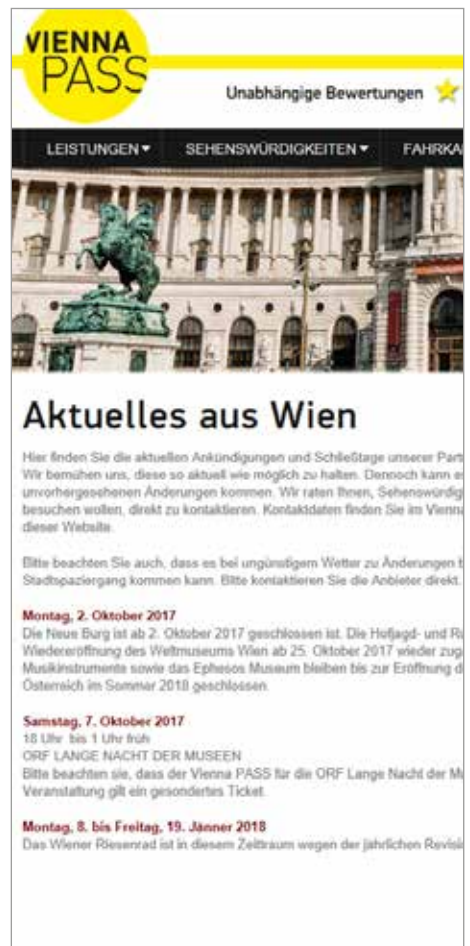
Vienna PASS Infoseite