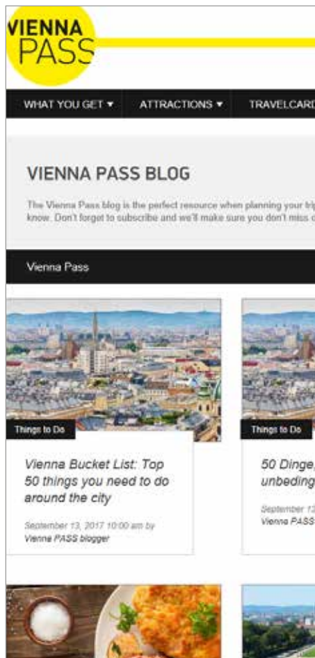
Vienna PASS Blog